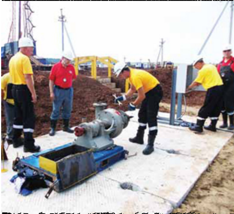
Работники предприятия в процессе монтажа оборудования на объекте