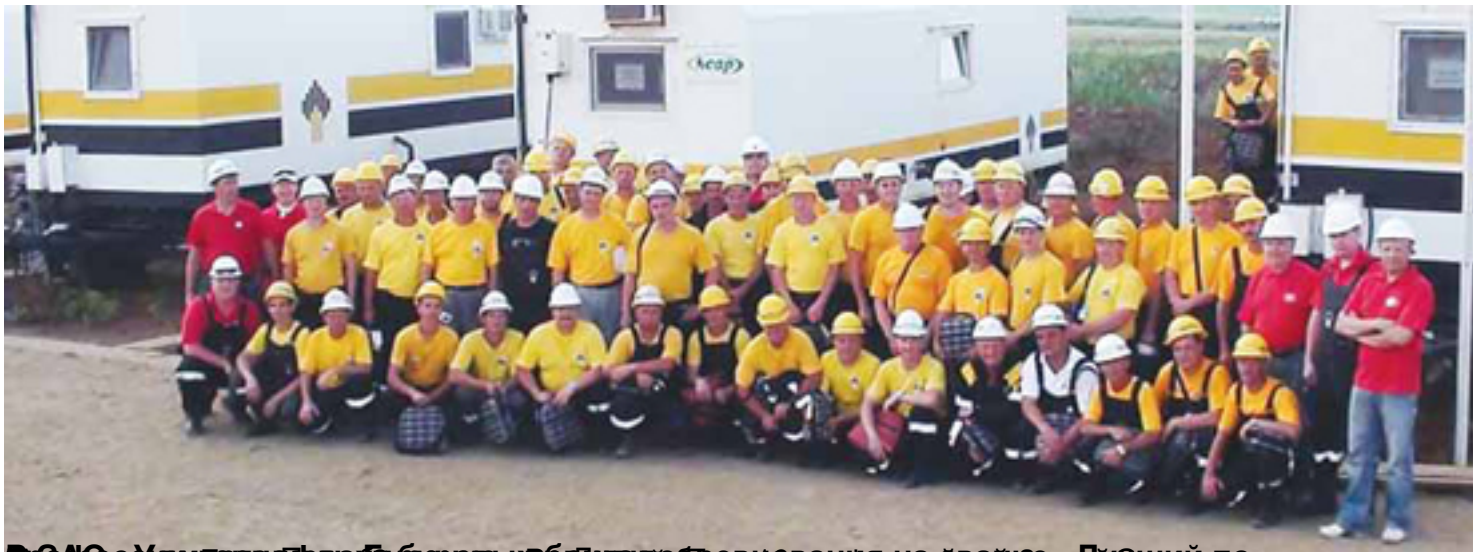
Фотозапечатывание в память об успешном завершении работ по монтажу оборудования на объекте